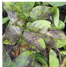
Penyakit hawar daun ( Phytophthora infestans )