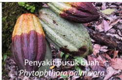
Penyakit busuk buah Phytophthora palmivora