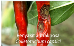
Penyakit antraknosa Colletotrichum capsici