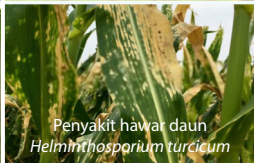
Penyakit hawar daun Helminthosporium turcicum