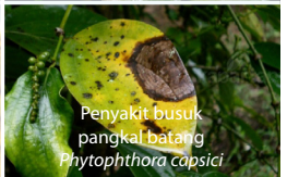
Penyakit busuk pangkal batang Phytophthora capsici