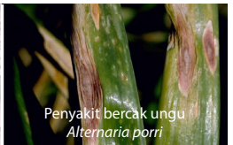
Penyakit bercak ungu Alternaria porri