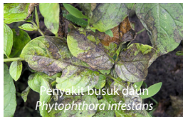
Penyakit busuk daun Phytophthora infestans