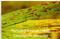
Penyakit bercak coklat Cercospora janseana